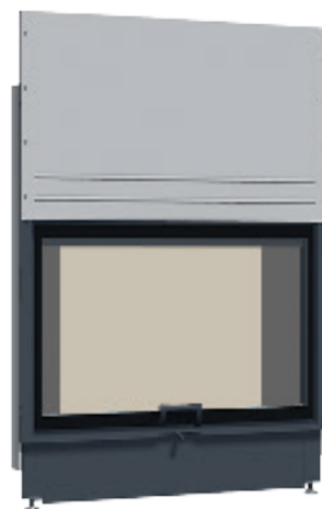
Lina 12080 h с открытием дверцы вверх

Возможны технические изменения. Дальнейшая информация на www.schmid.ru