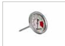
Термометр Арт № 201057-J