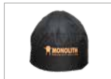
Чехол ICON Арт № 102028