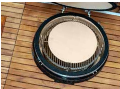
Камень для пиццы