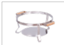
Подставка из нержавеющей стали Арт № 102027