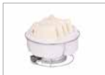
Внутренняя футеровка с каркасом Арт № 201053-J