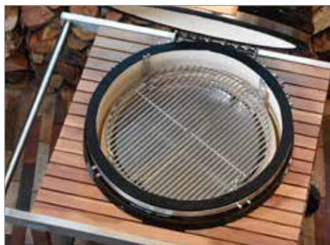
Дефлекторный камень с решеткой гриля из нержавеющей стали