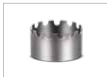
Подставка для Wok Арт № 102022