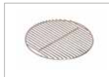
Решетка из нержавеющей стали Арт № 201060-J