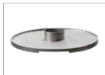
ICON планча Арт № 102021