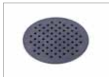
Колосник Арт № 201066-J