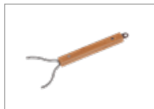
Съемник для решетки Арт № 206000