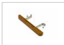
Бамбуковая ручка Арт № 201064-J