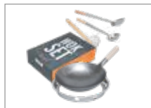
WOK набор Арт № 207013