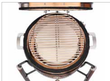
Решетка гриля, дефлекторный камень и второй уровень решетки