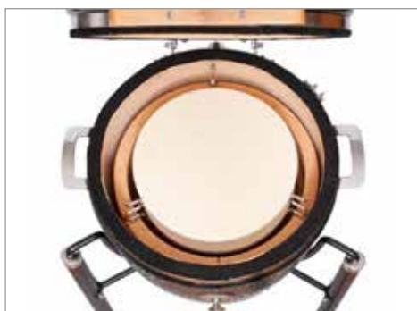
Камень для пиццы