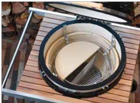
Решетка системы SGR и дефлекторный камень