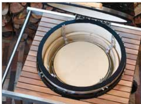
Решетка системы SGS и дефлекторный камень