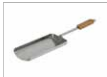
Совок Арт № 207042