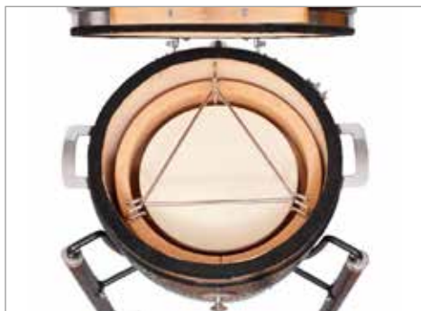
Дефлекторный камень с подставкой