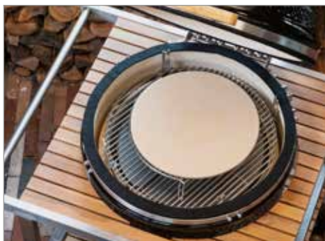
Камень для пиццы