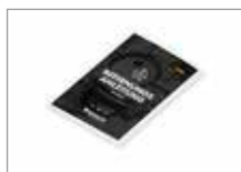
Руководство пользователя Арт № 20000-HB