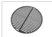
Чугунная решетка, ICON Арт № 201029