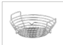
Корзина для угля Арт № 201046-J