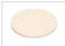
Камень для пиццы Арт № 201025