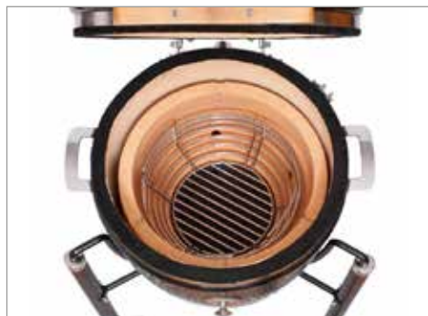
Корзина для угля (дополнительный аксессуар)