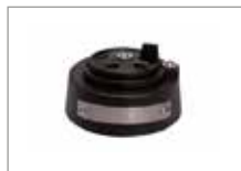
Чугунна крышка-регулятор Арт № 201059-J