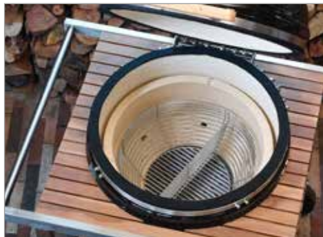
Корзина для угля с разделителем